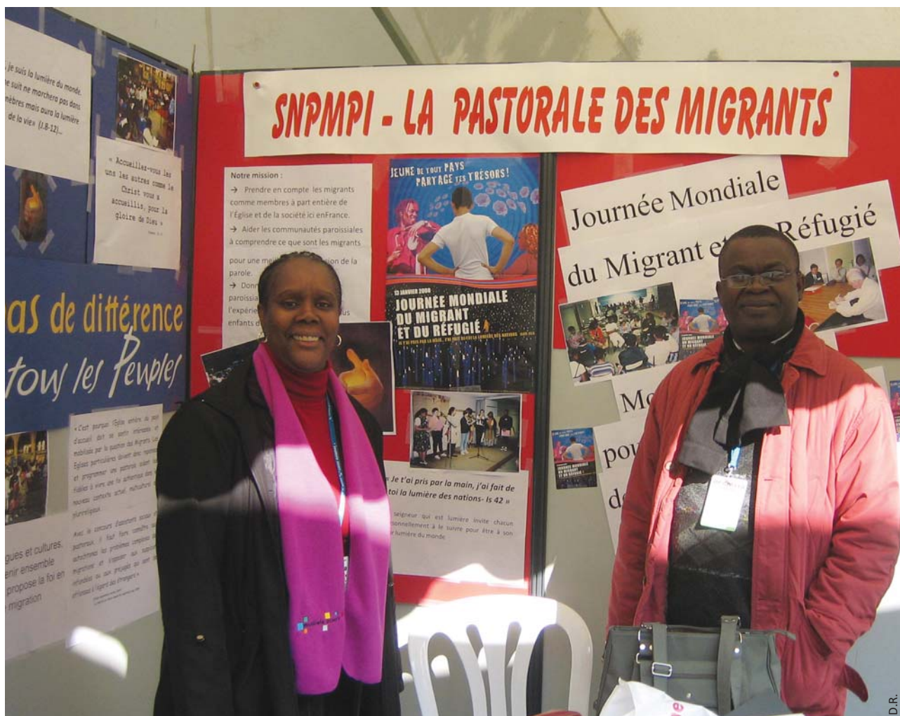
Permettre aux migrants de se découvrir eux-mêmes.

C'est donc dans ce flou identitaire que les Antillais vont tenter de se construire de génération en génération, flou psychologique, flou culturel, flou religieux. Les professionnels en psychologie disent tous que « garder le silence, c'est permettre la malédiction de la torture de poursuivre la personne ». En mars 1946, les colonies des Antilles deviennent des départements français. Plusieurs mesures vont être mises en place pour aider ces départements à se construire, mais ces départements sont dans un tel état, que de façon générale, les espoirs sont vite déçus. La crise économique et sociale est là. C'est cela qui va donner naissance à des groupes politiques indépendantistes, nationalistes. C'est dans ce contexte un peu agité, avec une population surpeuplée, des ressources pas suffisantes que le BUMIDOM (Bureau pour le développement des migrations intéressantes les départements d'Outre-Mer) va jouer un rôle déterminant dans l'histoire des migrations antillaises, et marquer collectivement la mémoire des